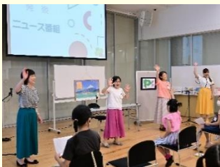
※講師の人数は回によって変わる可能性があります